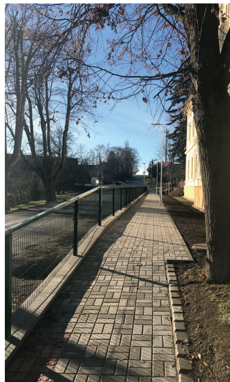
EVROPSKÁ UNIE Evropský fond pro regionální rozvoj Integrovaný regionální operační program MINISTERSTVO PRO MÍSTNÍ ROZVOJ ČR