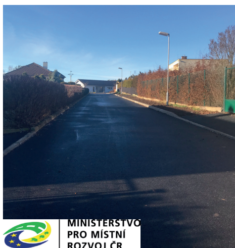
MINISTERSTVO PRO MÍSTNÍ ROZVOJ ČR

V listopadu proběhla částečná rekonstrukce povrchu v ulici Družstevní a kompletní rekonstrukce ulice Nová, kde byly konečně odstraněny původní panely. Akce byla podpořena z rozpočtu Ministerstva pro místní rozvoj ve výši 701 399 Kč. Za podporu velmi děkujeme. Celkové náklady akce byly 1 681 580 Kč.